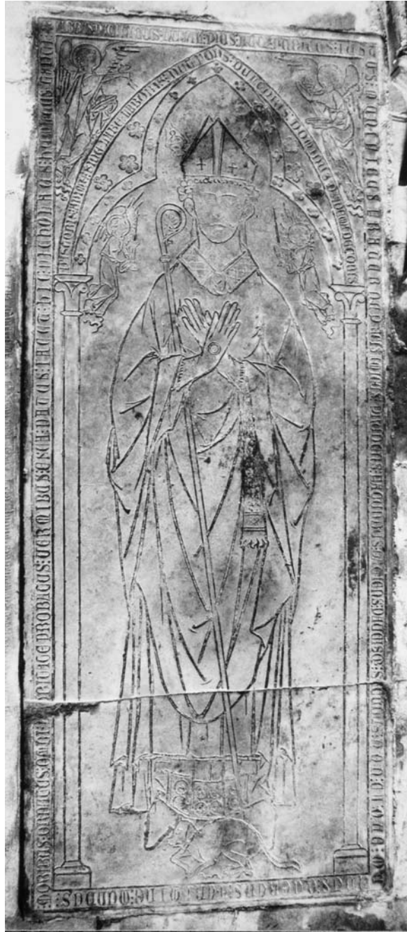
Fig. 2 : Rouen (76), Saint-Ouen, église, dalle encastrée dans le pavement de la troisième chapelle. Plate-tombe de Nicolas de Goderville. CIFM 22, 223, p. 308-310, fig. 103.