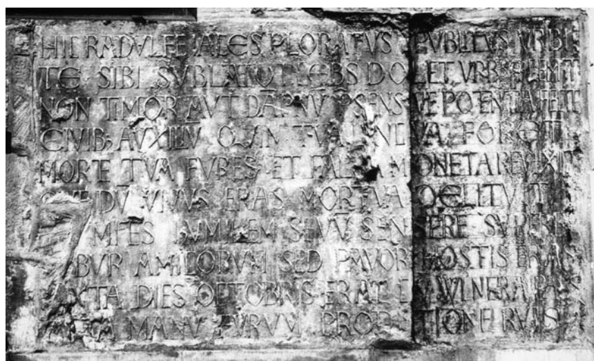
Fig. 1: Rouen (76), cathédrale, mur occidental de la deuxième chapelle du bas-côté nord. Inscription funéraire de Raoul. CIFM 22, 191, p. 285-286, fig. 101.