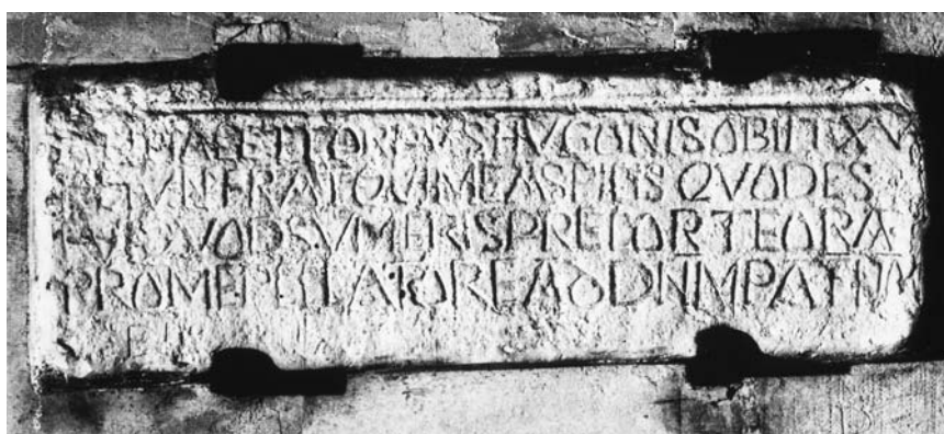
Fig. 4 : Évreux (27), musée, salle médiévale. Inscription funéraire pour Hugues. CIFM 22, 90, p. 150, fig. 37.